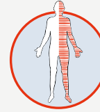
Aniden oluşan vücudun bir tarafında güç veya his kaybı