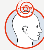
Aniden oluşan baş dönmesi ve dengeyi sağlama sorunu