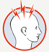
Aniden oluşan nedeni bilinmeyen yoğun baş ağrısı