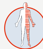
слабость или нарушение чувствительности в руке или в ноге