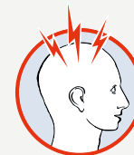
очень сильная головная боль